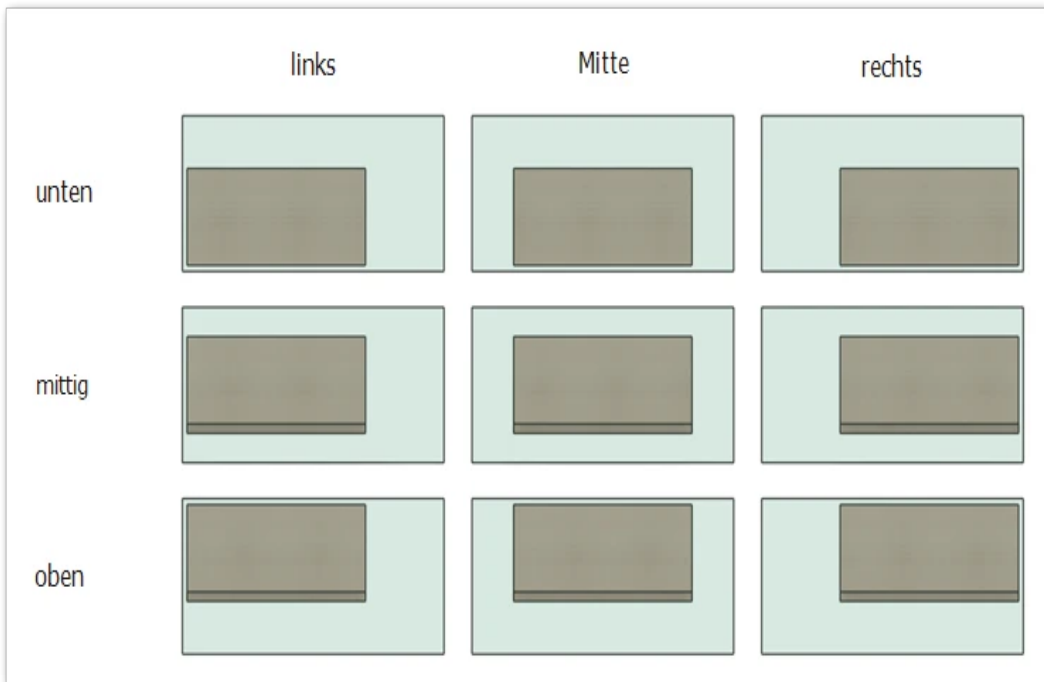
Darstellung der Möglichkeiten für "Position im Rohling" mit Offsets

Für die Positionen mittig links und mittig rechts bleibt der Wert aus Offset vertikal , für unten Mitte und oben Mitte der Wert aus Offset horizontal unberücksichtigt. Für die Position zentriert ("mittig Mitte") werden keine Offsets berücksichtigt.